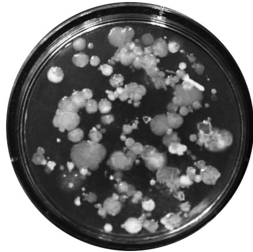
afdruk van binnenkant koelkast